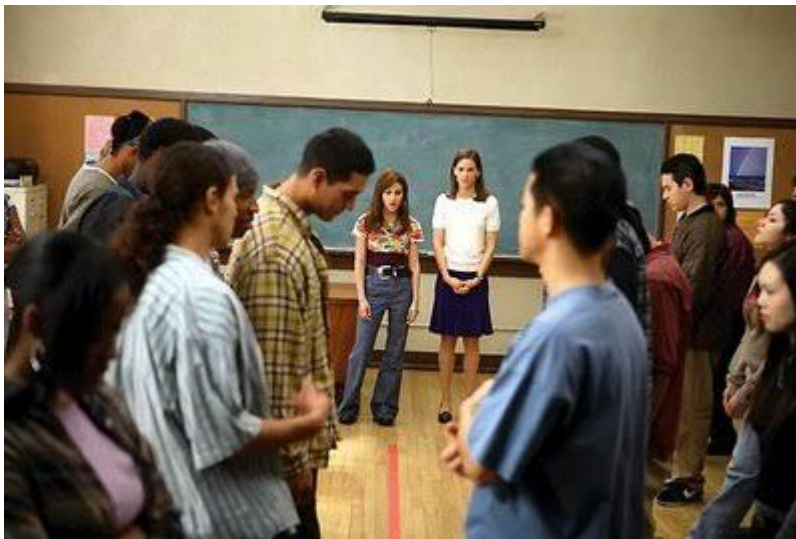
Imagem 2: Cena do "escritores da liberdade" dinâmica proposta para os alunos